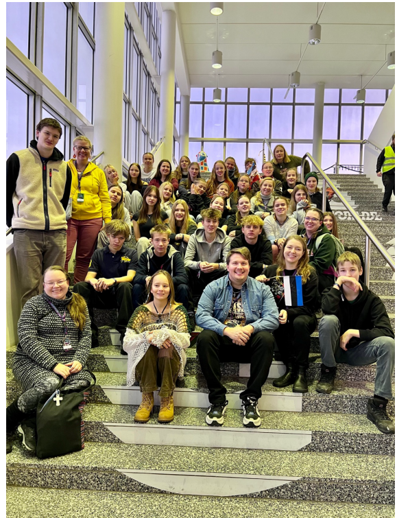
Viron nuorten kanssa Suomen Turussa Maata Näkyvissä festareilla 2024

Eräs nuoristamme todisti hienosti tänä syksynä ikätovereilleen: ”Tää on ihan mahtavaa, kun mä tiedän, etten mä ole koskaan yksin. Jeesus on mun kanssa ja saan aina luottaa, että hän auttaa mua. Olen niin kiitollinen, että Hän on antanut mulle uuden mahdollisuuden.”