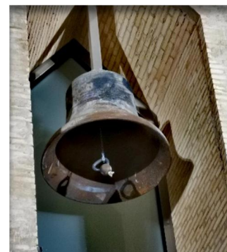
Kuva 1 Ylivieskan vanhan kirkon kello koristaa uutta kirkkoa.

Rakkaat ystävät ja lähetystyön tukijat. Toivottavasti olette kaikki hyvin olemassa. Kiitos, että jaksatte muistaa lähetystyötä rukouksin ja mukana eläen. On suuri kiitoksen aihe tietää, että meidän ei tarvitse tehdä tätä työtä yksin, vaan mukana on suuri joukko uskollisia ystäviä ja kaikkivaltias Jumala.