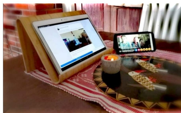
Kuva 2 Virtuaalikalhveilla

Vuosi sitten tämä kummallinen aika alkoi eikä se tunnu vielääkään päättyvän. Joudumme elämään eristyksissä toisistamme, jumalanpalvelukset järjestetään virtuaalisesti kuten monet muutkin toiminnot. Olemme opetelleet osallistumaan seuroihin etäyhteyksien välityksellä. Opetteluahan tämä kaikki vaatii, mutta seurapuheet ja virret koskettavat kyllä etäyhteydelläkin. Kiitollisina olemme Päivin kanssa herättäjäseuroja kuunnelleet ja arvostamme heitä kaikkia, jotka ovat tehneet seurojen toteuttamisen mahdolliseksi. Myös Suomen Lähetysseura järjestää satunnaisesti virtuaalisia kirkkokahveja sunnuntaisin eri puolilta maailmaa. Niissäkin pääse mukavasti seuraamaan elämää ja työtä Lähetysseuran työalueilla. Kannattaa seurata Lähetysseuran Facebook sivuja, sieltä löytyy tietoa, milloin ja mistä kirkkokahvit järjestetään.