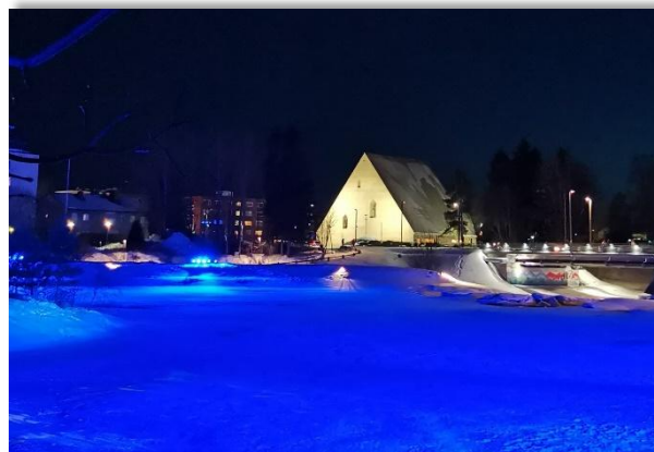
Kuva 4 Ylivieskan uusi kirkko

Vanha kirkko oli monille rakas ja siihen liittyi muistoja elämän kaikista vaiheista syntymästä kuolemaan. Vanhaa kirkkoa ei enää ole, mutta muistot eivät pala ja nyt saamme uusia muistoja uuden kirkkomme myötä.