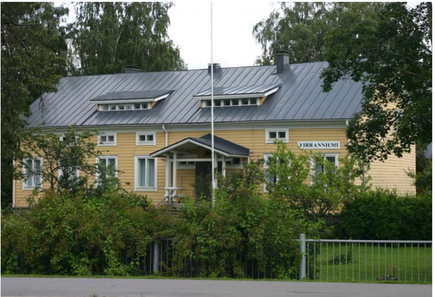
2 Ainakin vielä 1900-luvun alussa pappilassa tunnettiin Klingsporin ja Kulneffin huoneet niissä majailleiden upseerien mukaan. Sittemmin pappilan sotilaallisiin asukkaisiin liittyi myös C. G. E. Mannerheim, joka majoitettiin Virranniemeen hänen vieraillessaan Lapualla kesällä 1920.