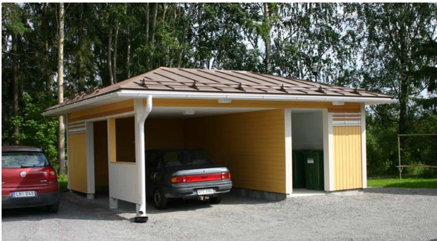
Tiistenjoen monitoimitalon varasto ja autokatos.