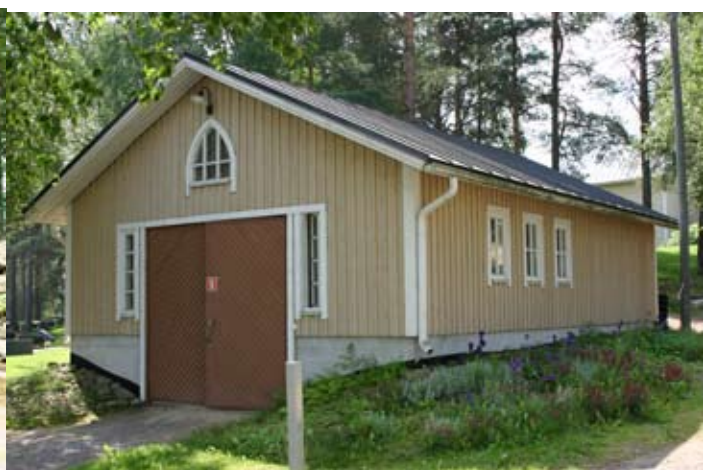
Tiistenjoen hautausmaan varasto.