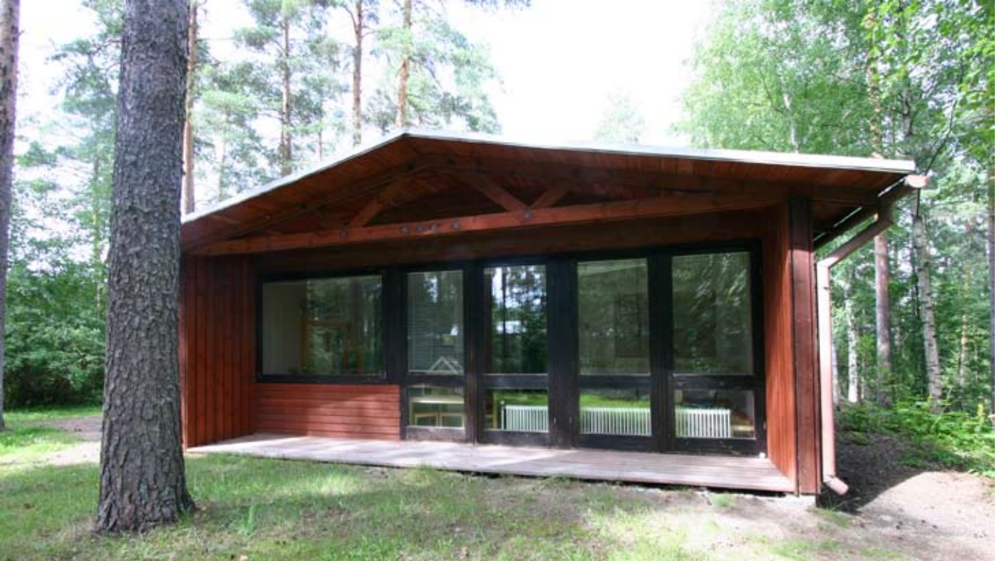
Kaaranmännikön entinen isännän asunto, nykyinen kerhotalo.

Kaaranmänniköstä tuli heti niin suosittu, että tarve sen talvikäyttöön kasvoi. Jo vuoden 1970 lopulla todettiin leirimuotoisuuden olevan taakse jäänyttä elämää. Nyt tarvittiin laadukkaampia majoitustiloja ja telttojen ja rauhattomiksi osoittautuneiden yhteismajoitussolujen tilalle.