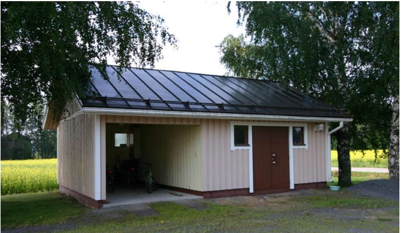
Kauhajärven seurakuntakodin yhteyteen valmistuivat ulkovarasto ja autotalli vuonna 1989.

Kauhajärven seurakuntakodin alkuperäinen tasakatto muutettiin harjakatoksi vuonna 1989, jolloin ullakosta tehtiin varasto. Rakennus maalattiin seuraavana vuonna, ja samalla lattiapäällysteeksi vaihdettiin muovimatto entisten kokolattiamattojen sijaan. Vuonna 2005 halkeillut Vartti-levykatto muutettiin konesaumatuksi peltikatoksi.