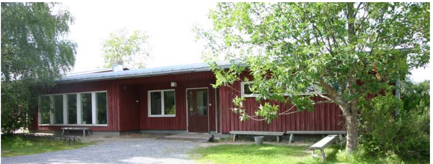
Simpsonin hautausmaan huoltorakennus.

Jo vuonna 1965 todettiin, että hautausmaalla tarvittaisiin myös erillinen huoltorakennus, mutta piirustukset sitä varten tilattiin rakennusmestari Vilho Tuomaalalta vasta 1970-luvun alussa. Huoltorakennus valmistui vuonna 1972. Rakennuksessa on lämmintä tilaa 125 m 2 ja kylmää varastotilaa 75 m 2 . Siellä sijaitsevat mm. hautausmaan työntekijöiden pesutilat, toimisto, ruokailutila ja yleisökäymälät.