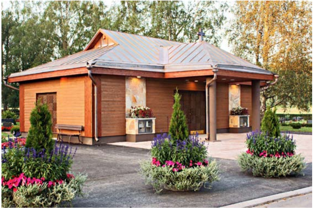
Uusi talvihauta valmistui 2009.

huoneen puolelle koneelliset jäähdytyslaitteet. Samalla kellarin päällä olevaan rakennukseen valmistui varastuhuone. Rakennus maalattiin ulkoa ja paneloitiin sisältä vuonna 1975 ja sementtitiilikatto muutettiin Vartti-levykattoksi vuonna 1989.