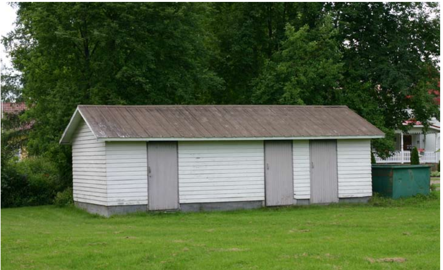
Tuomiokirkon ulkorakennus nykyasussaan.

Kamiinoiden vuoksi kirkossa piti olla oma lämmittäjänsä, jonka tehtäviin kuului myös kirkon siivoaminen, lumien luonti, kolehdin kannossa auttaminen ja alttarikehän sisäpuolelle vievän portin avaaminen papille. Vuonna 1938 päätettiin korottaa lämmittäjän palkkaa, koska uusien urkujen vuoksi kirkkoa piti vuoden kylmimpinä kuukausina lämmittää joka päivä. Pölynimuri hankittiin seuraavana keväänä helpottamaan saarnastuolin ja polvistumislaudan samettipäällysteiden puhdistamista.