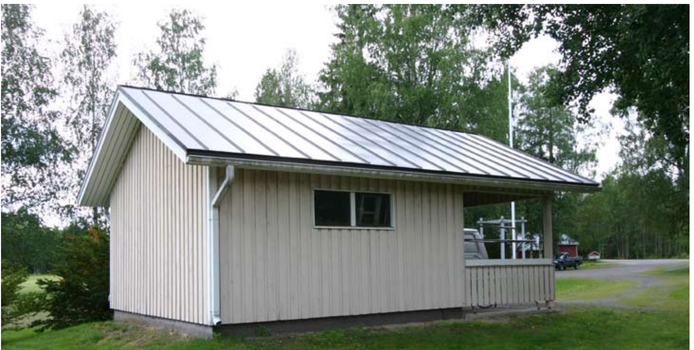
Hellanmaan seurakuntakodin ulkovarasto ja autotalli valmistuivat vuonna 1986.

Tämän jälkeen alkuinnostus seurakunnan puolelta hiipui. Valtuustossa todettiin, että olisi tasapuolisuuden vuoksi otettava huomioon myös muut kauempana keskustasta sijaitsevat kylät, kuten Kauhajärvi. Lisäksi elettiin maaltapaon aikaa, ja luottamuselimissä epäiltiin, riittäisikö seurakuntakodilla käyttäjiä. Siksi kirkkohallintokunta velvoittikin taloudenhoitajan selvittämään kauppalan eri osien väestökehitysarviot. Kun seurakuntakotiin liittyvissä asioissa oltiin vielä Hellanmaassa erimielisiä, katsottiin parhaaksi jättää asia yksimielisyyteen pyrkivässä seurakunnassa pöydälle.