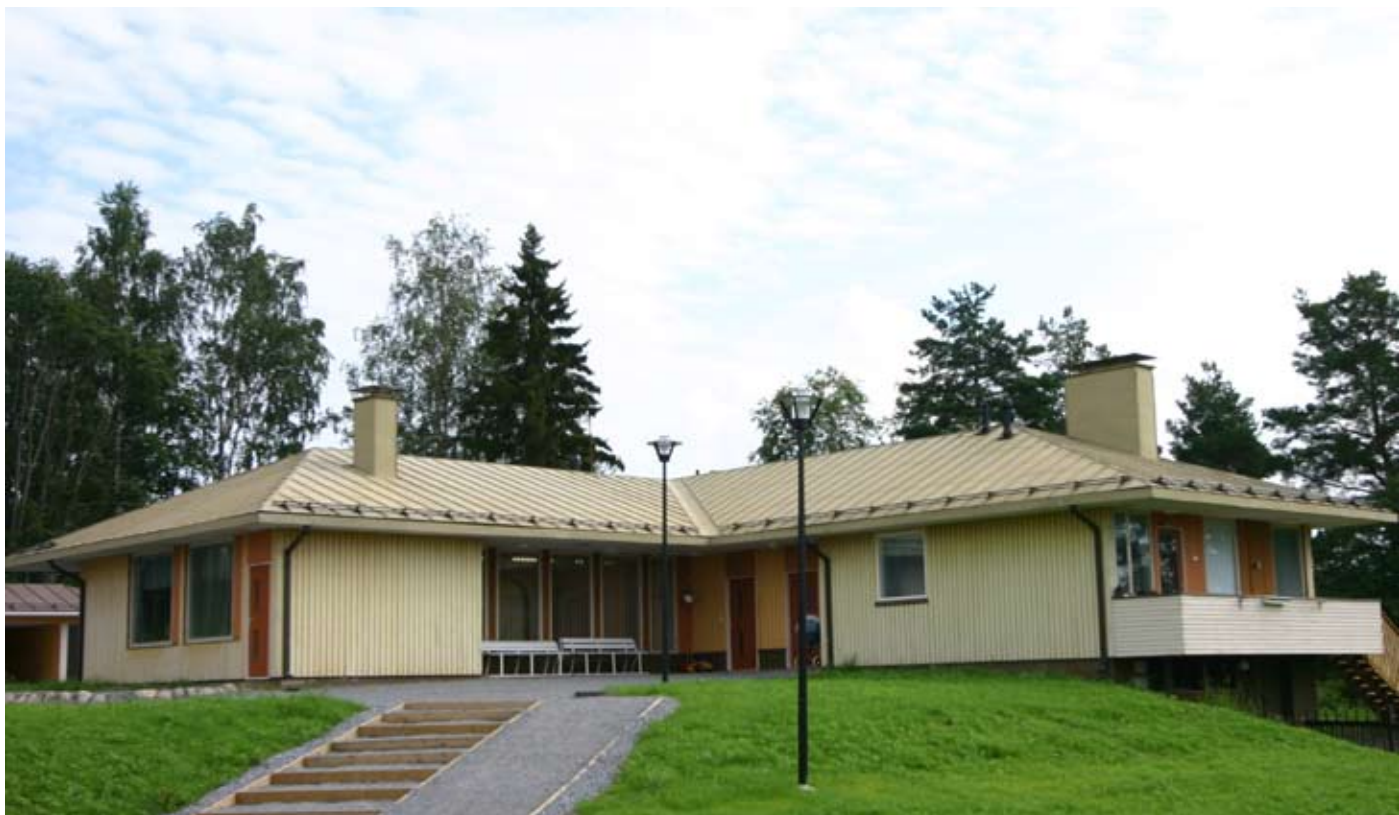
Tiistenjoen entinen pappila, nykyinen monitoimitalo.