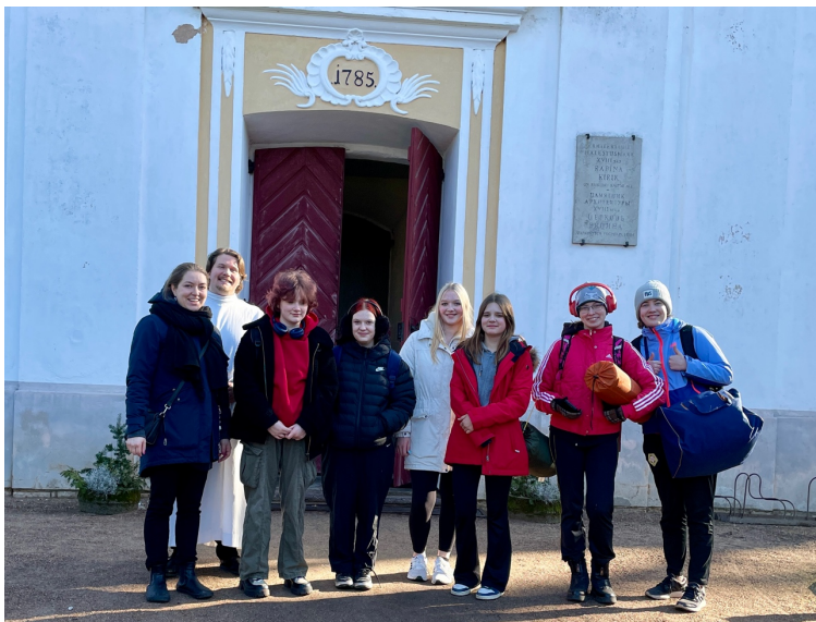
Räpinan nuortenleirin porukkaa ennen leirin päättäneyttä jumalanpalvelusta