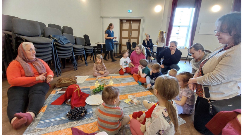
Pääsiäistapahtuma Kanepin seurantalolla

Viron seurakunnissa oli monenlaista tarjontaa pääsiäisen ajalle. Me järjestimme lankalauantaina pienessä Kanepin kylässä pääsiäisteemaisen perhepäivän. Todelliseksi järjestäjien yllätykseksi Kanepin seurantalolle saapuikin noin 50 lasta, nuorta ja vanhempaa, vaikka odotimme vain muutamaa. Perheet pääsivät monenlaisten käsitöiden, aktiviteettien ja opetuksen kautta tuttavaksi pääsiäisen tapahtumien kanssa, jotka monille olivat aivan tuntemattomat. Mieleen jäi yksi isä, joka oli saapunut paikalle pienten lastensa kanssa, ja tuli tapahtuman loppuksi vuolaasti kiittelemään, että tällaista järjestetään. Kutsuimme heidät mukaan nyt virinneeseen viikottaiseen pyhäkouluun.